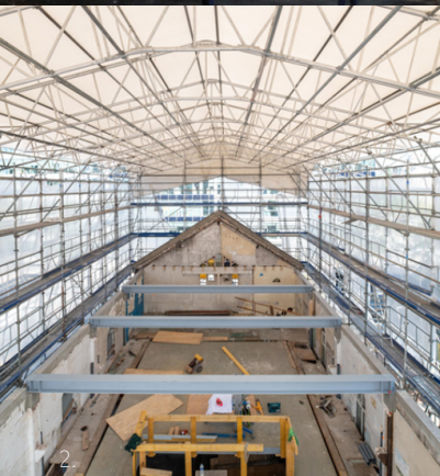
1. Chantier d'aménagement de la ferme d'insertion à Bénerville (67) 2. Chantier de restructuration de la Communauté Emmaüs Liberté à Charenton-le-Pont (94)